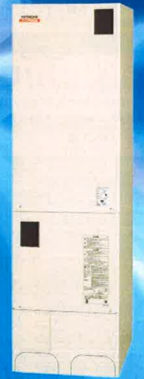
BHP-FW46JDK 貯湯ユニットの写真は脚カバー(別売)装着品です。